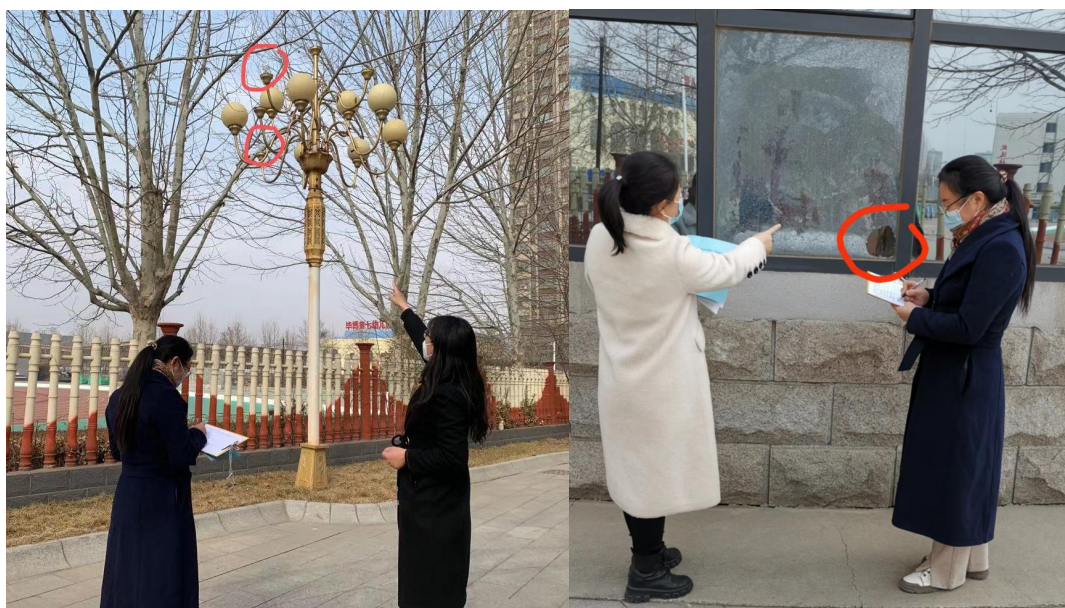
图4 安全卫生处对学校进行安全隐患排查

墙砖金属护角破损脱落、安全出口标志破损脱落、路灯、门厅灯灯罩破损缺失、消火栓无水带、高处双层玻璃的外层破碎、西院墙有处顶部墙砖松动、个别地方悬挂电线下垂、操场南看台墙边有未拆清的铁制突出物等，均有安全隐患。对存在的这些安全隐患，学校领导高度重视，相应部门立即着手进行检测维修，不能维修的已经粘贴了隐患警示标识。通过此次排查，及时发现了学校的一些安全隐患并及时进行了维修，并带动学校各部门进行安全隐患的自测自检。对全体师生的生命、财产安全和学校正常的教育教学秩序提供了有力保障。