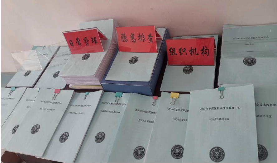
图5 安全、卫生工作档案

第五件事，面对最近流行的甲型流感及诺如病毒，安全卫生处积极应对，与学校各部门建立密切联系，随时关注师生的健康情况。结合各专业部切实做好晨午检体温监测，对学校重点区域，人员密集或流动大的地方，继续进行通风消杀工作，并做好记录。