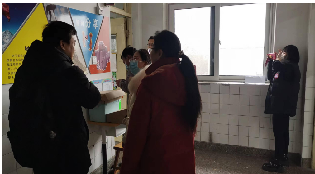
图 2 安全卫生处和象牙塔公司技术人员一起安装蓝牙设备